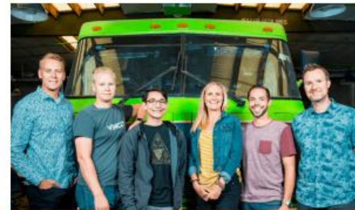
ROADTRIP NATION Hakusovellus yliopistoille