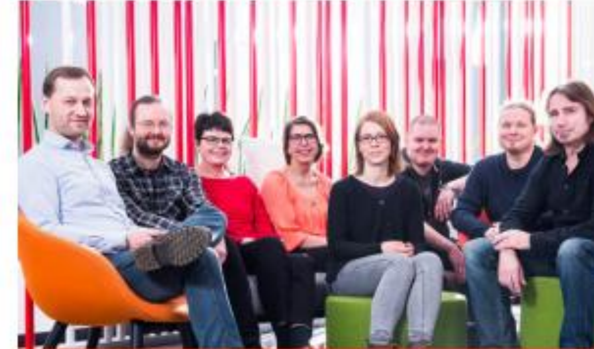
FONECTA Ohjelmistokehitystä ja integraatioita