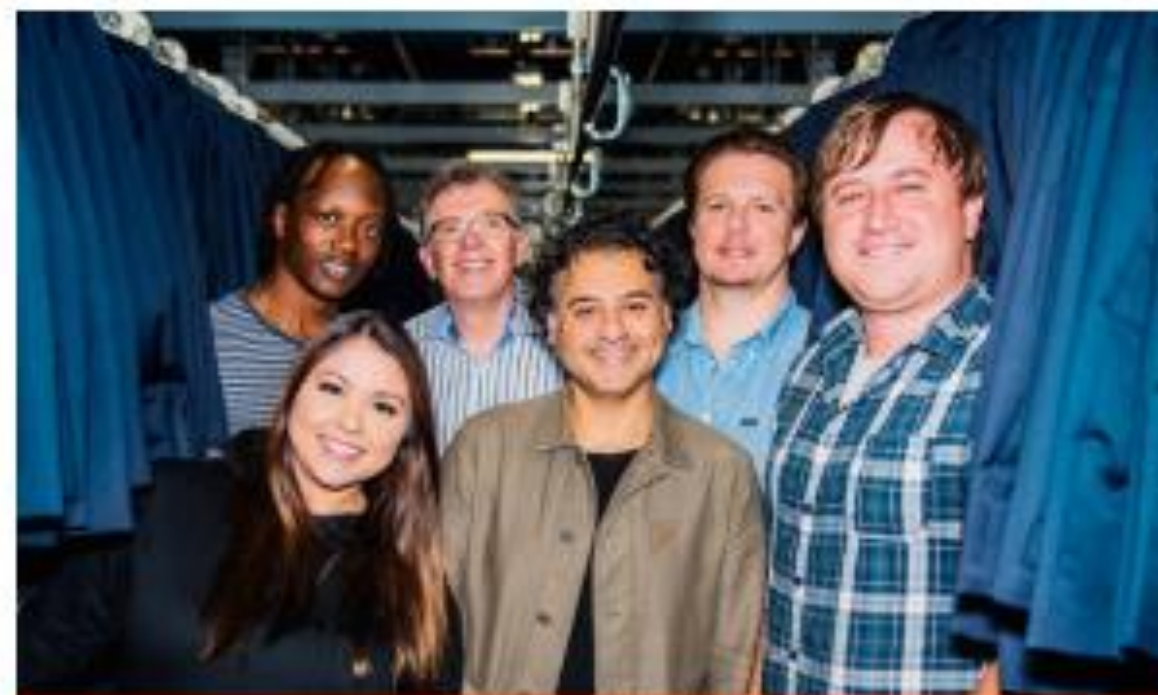
STITCH & TIE BY FRIAR TUX Vuokraa kustomoitu puku tai smokki netistä