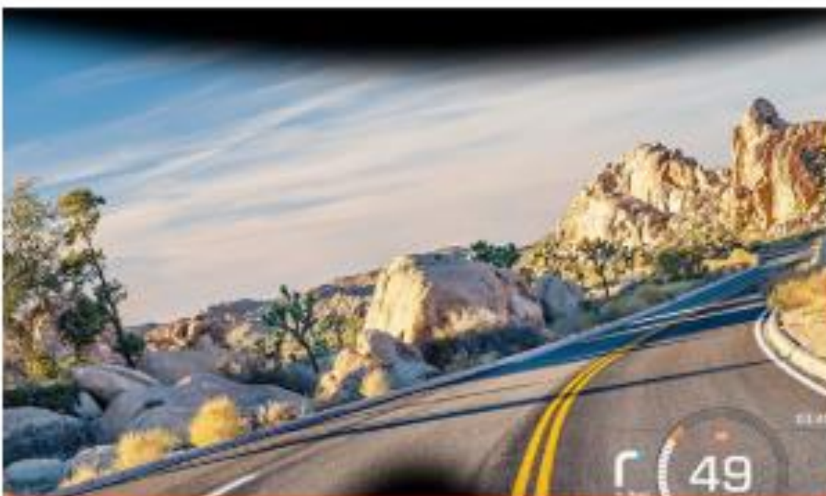
NUVIZ Katse eteenpäin, motoristi!