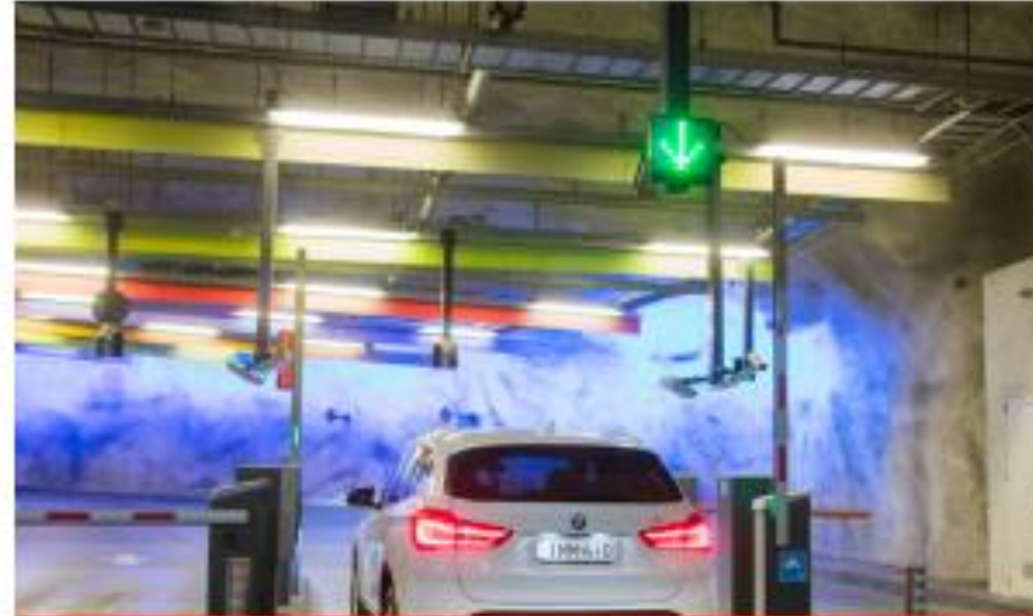
FINNPARK Moovy parkkipalvelu