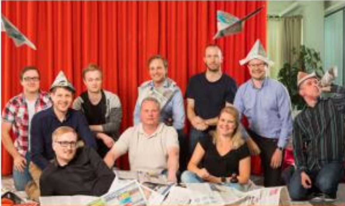
KAAKON VIESTINTÄ Mediatalolle moderni verkkopalvelu